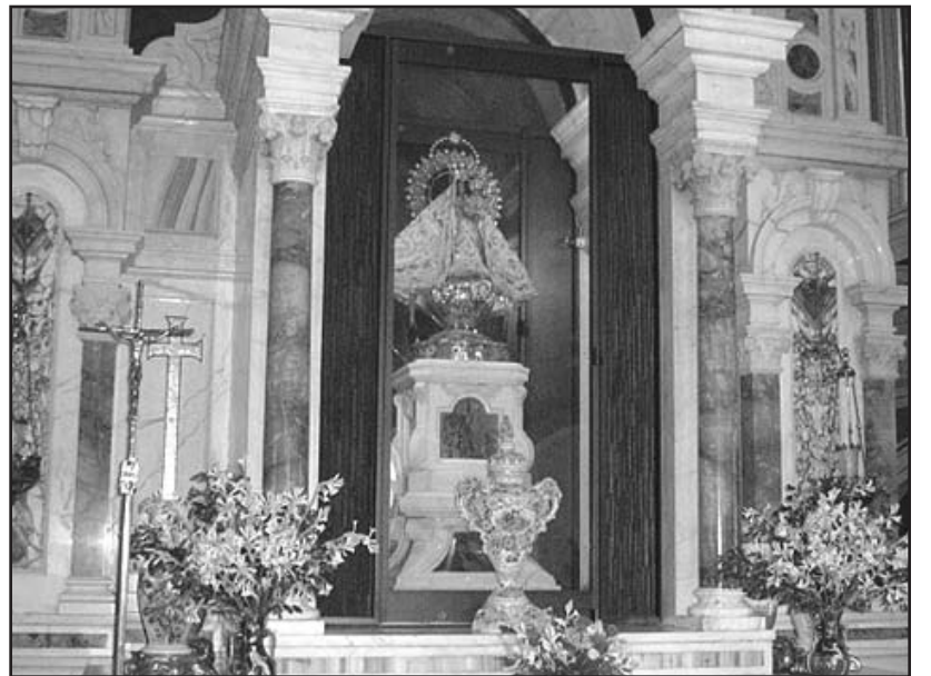
La Virgen de la Caridad del Cobre en el Santuario Nacional

El primer trono de la Virgen de la Caridad fue el mar cuyas ondas suaves y ondulantes bañan las playas de finísima arena, pero a veces esas aguas abruptamente chocan contra las rocosas costas de la isla dando Ella a entender, desde entonces, que así se escribirían las páginas de la Historia de Cuba; ...empero, allí estuvo la Virgen a la par de nuestros hom-